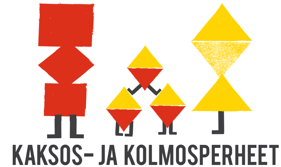
KAKSOS- JA KOLMOSPERHEET