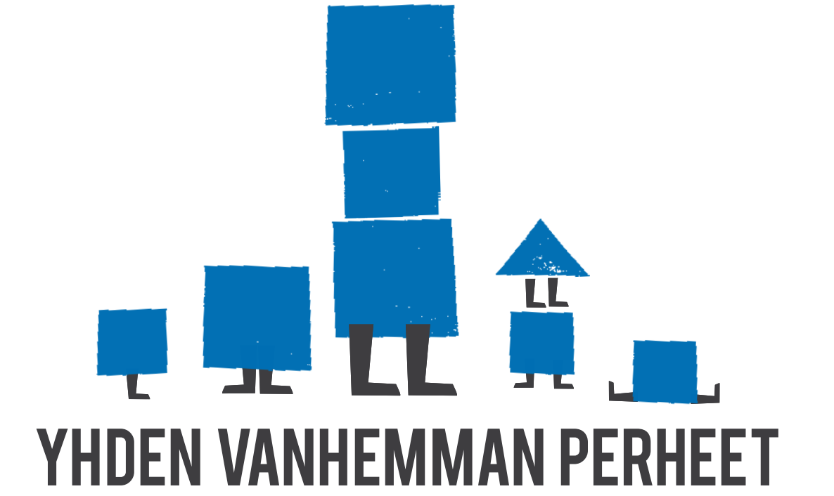
YHDEN VANHEMMAN PERHEET