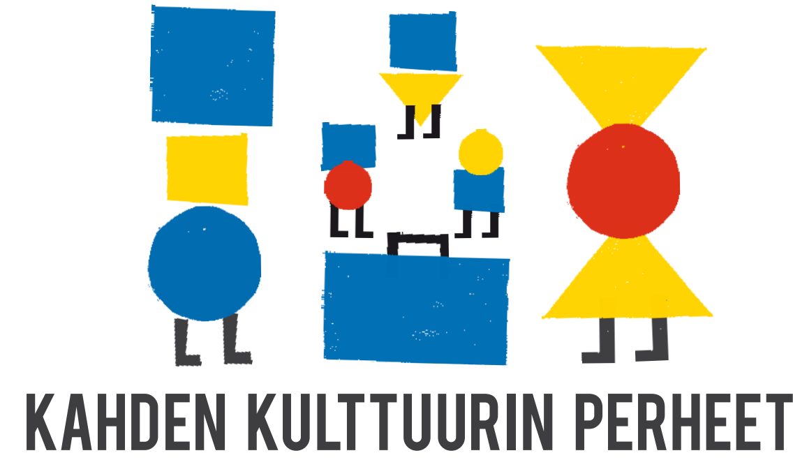
KAHDEN KULTTUURIN PERHEET